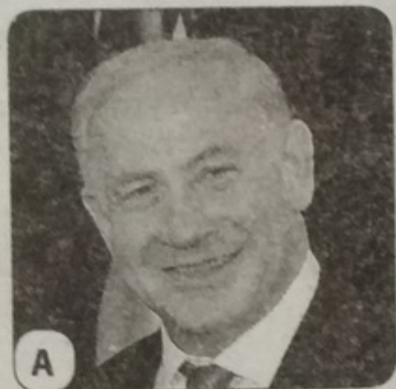
А Б. Нетаньяху