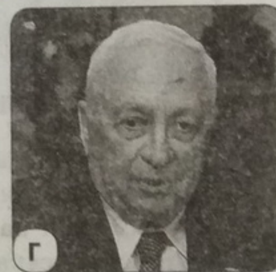
Г А. Шарон

4 У 1980—1988 рр. Іран вів тривалу війну з